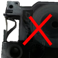
סרט הדיו לא מתוח