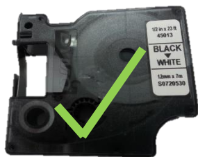
סרט הדיו מתוח